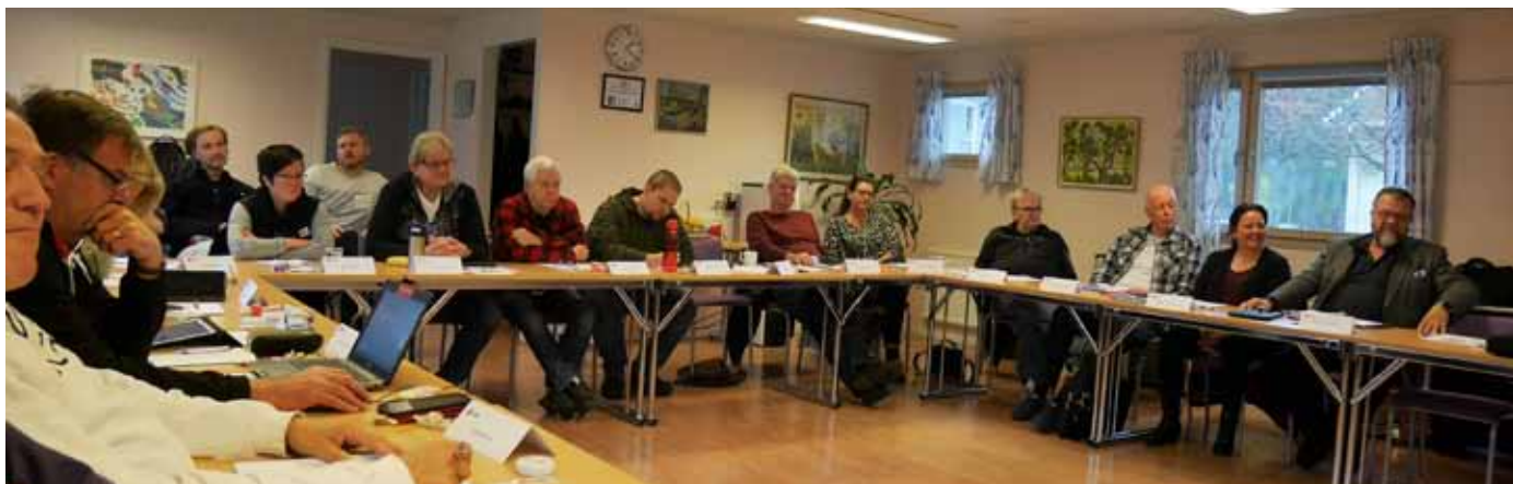
Deltagarna på ordförandekonferensen.