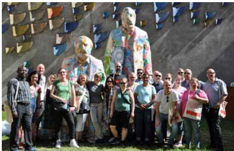
GAF klassen utanför Rosa Luxemburgstiftelsen.