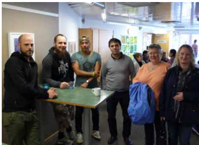
Deltagare på seminariet