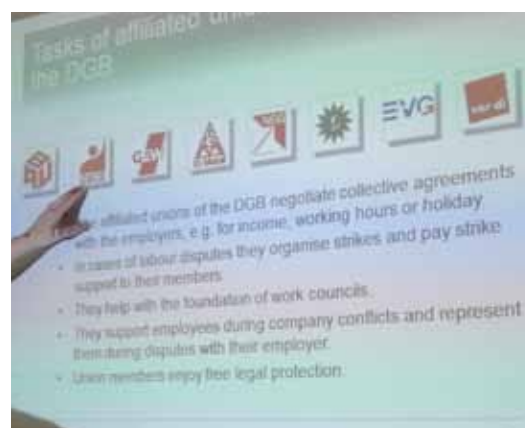
DGB, Tyska LO i Berlin.