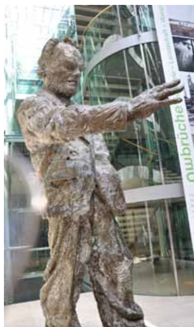
SPD Wily Brandt Haus.