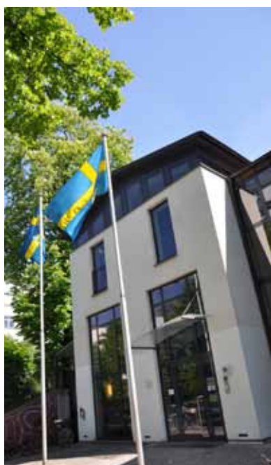
Svenska Kyrkan i Berlin.