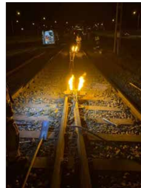
Dags att bränna de första svetsen, förvärmning av rälsändar i 2 minuter innan termitgrytan lyfts på plats för antändning.

Arbetet utförs på drift och underhållskontraktet BKB/KTK. (Blekinge kust banan samt Kust till Kust banan).