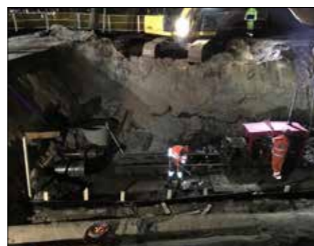
Tryckning under några högspänningskablar har också utförts med lyckat resultat.