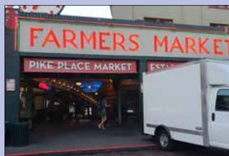
Farmers Market i Seattle.