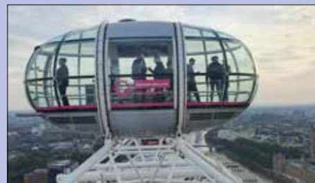
Golden Eye i London.