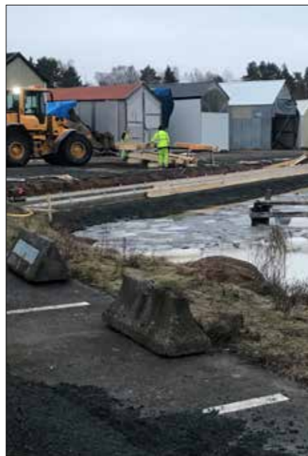
I Näckströms hamn i Tranås bygger Kanonaden nya bryggor åt Tranås motorbåtsklubb.